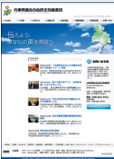
◀自民党県議団ホームページ