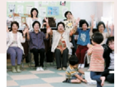
▲お年寄りの元気づくりに取り組みます